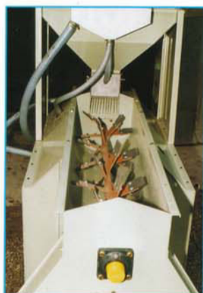
▲ Mélangeur horizontal à battes caoutchouc (préserve les grains)

S.A. au capital de 200 000 F - SIREN 351 462 714 RCS Troyes