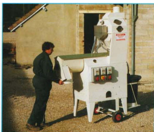
▲ En option : • roues de manutention • support de récipient

Options : • kit amont (vis avec raccord tournant) • kit aval (vis sur chariot avec trémie)